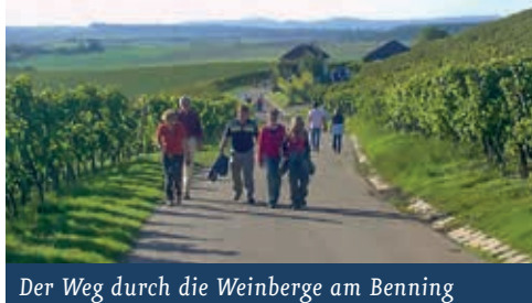
Der Weg durch die Weinberge am Benning

Diese Wegbeschreibung beginnt in Großbottwar bei der Kellerei der Bottwartaler Winzer, Oberstenfelder Str. 80. Neben dem Kellereigebäude befindet sich auf dem Parkplatz der Stand der ● Bottwartaler Winzer . Am äußeren Rand des Parkplatzes bei der Bushaltestelle geht es den